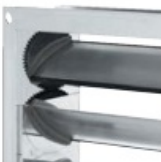
Zabudowane koła zębate