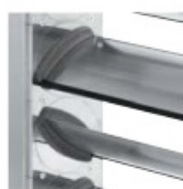
BOCZNE USZCZELNIENIE Z ZAMKNIĘTOKOMÓRKOWEGO MATERIAŁU